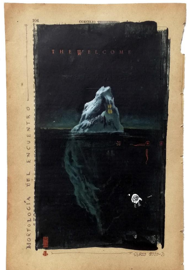
Iceberg nocturno (2020-2021) Óleo sobre papel. 22 x 17 cm.