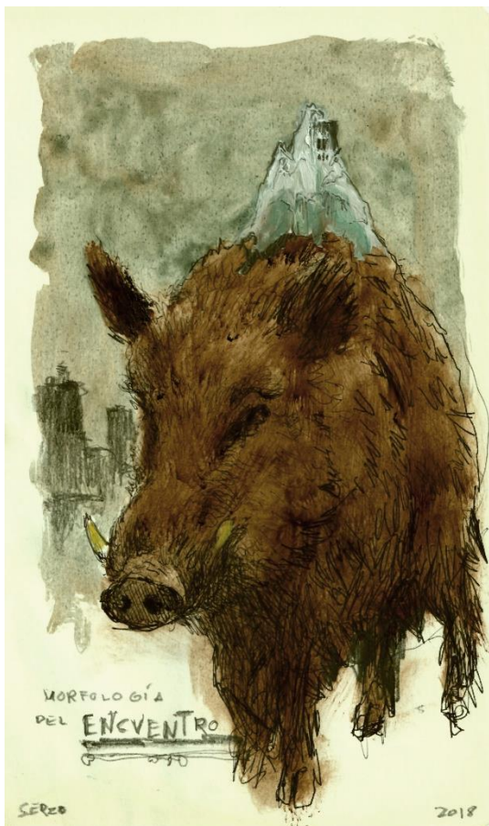
Instinto congelado II (2018) Óleo y lápiz sobre papel, 21 x 13 cm.