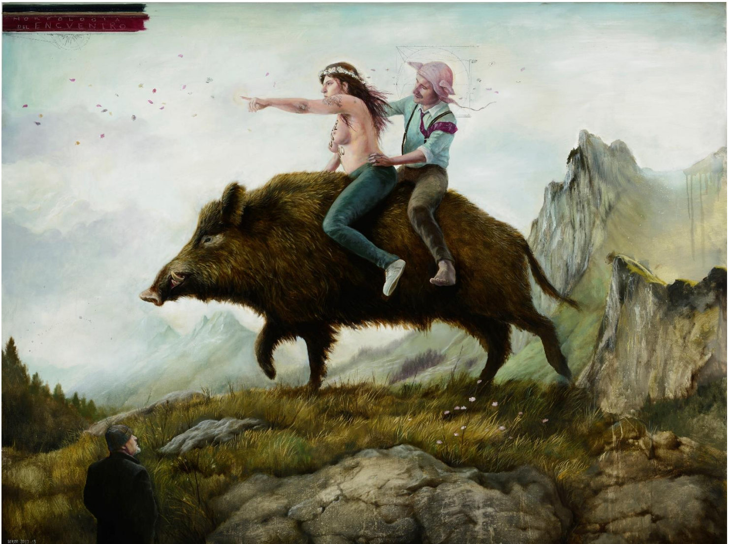
La travesía (2018) Óleo sobre lienzo. 150 x 200 cm.