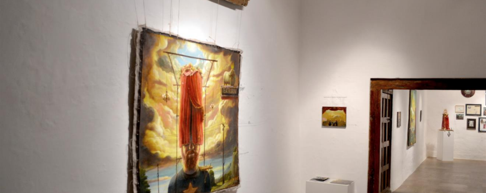
Montaje de Escenas y sucesos dentro y fuera de un Teatrorum (Galería Artizar, 2016)