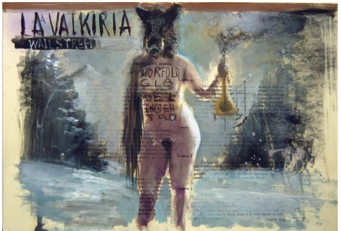
La valkiria de wall Street. El miedo y el deseo (2018). Óleo y carbón sobre papel. 46 x 32 cm.